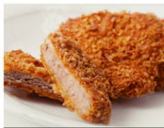
ひと口ヘレカツ (3枚入) ¥580 (税込¥627)