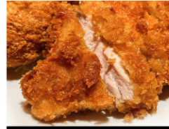
梅塩熟成チキンカツ (5個入) ¥580 (税込¥627)