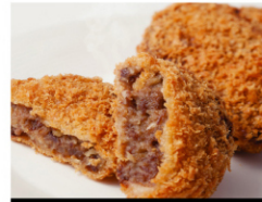
すき焼きコロッケ (5個入) ¥980 (税込¥1,059)