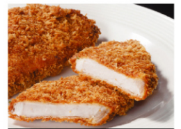
手作りとんかつ (2枚入) ¥780 (税込¥843)