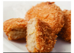
松牛NEWコロッケ (5個入) ¥780 (税込¥843)