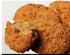
天空和牛コロッケ (5個入) ¥980 (税込¥1,059)