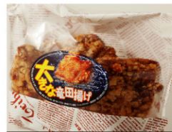
若鶏竜田揚げ (3枚入) ¥580 (税込¥627)