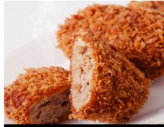
松牛ミンチカツ (5個入) ¥980 (税込¥1,059)