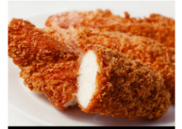
ササミフライ (3本入) ¥580 (税込¥627)